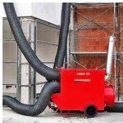
Exemple de système de chauffage indirect.